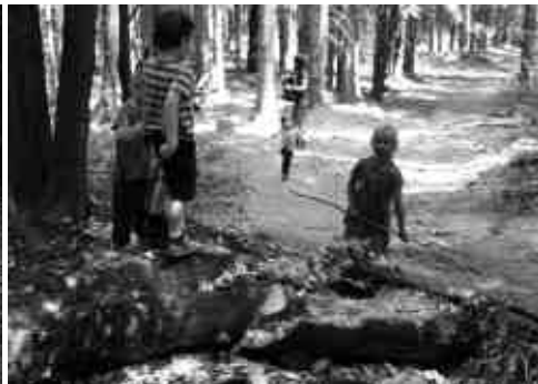
... a o několik hodin později již porcují svou kořist.