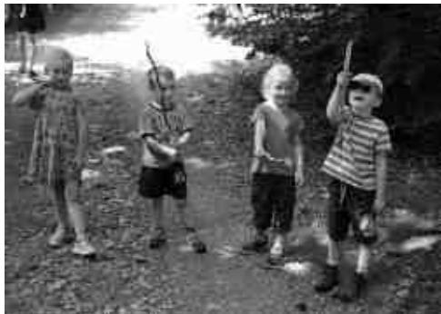
Malí indiáni plní loveckého nadšení bez bázně a hany chystají zbraně na lov bizona...